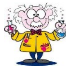
☞ Een raket bouwen en gebruiken, een waterstraalvoertuig of heftige cola, papier onderdempelen in water—nat of niet?

Verrassende proefjes met knallende kurken...nu heeft niets nog geheimen voor onze derdeklassers!